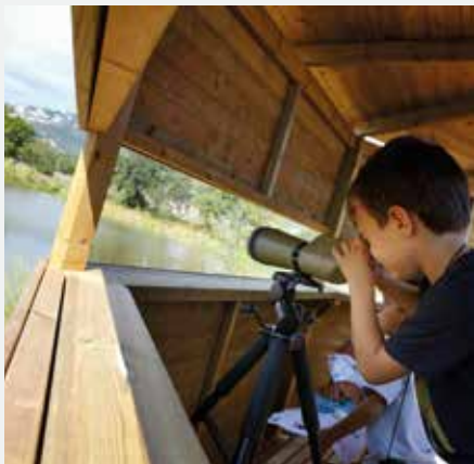
Visita naturalista al Parc dels Estanys Platja d'Aro