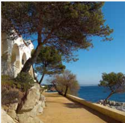
Camí de Ronda S'Agaró