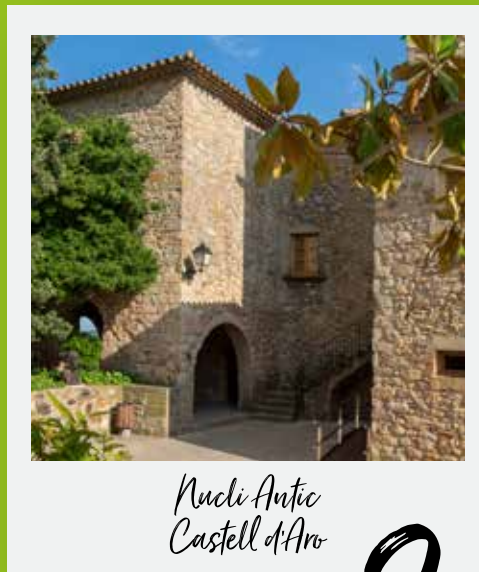
Nucli Antic Castell d'Aro