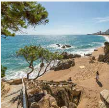
Camí de Ronda i Pla de Palol Platja d'Aro