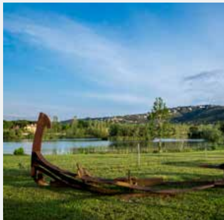
Escultora Parc dels Estanys Platja d'Aro

Wednesday 24th July - 21st August (7 pm) - cat / en