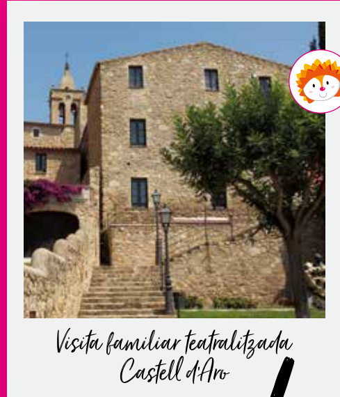
Visita familiar teatralitzada Castell d'Aro