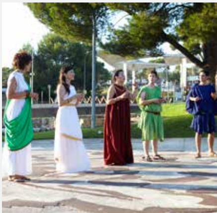
Vil·la romana Pla de Palol Platja d'Aro